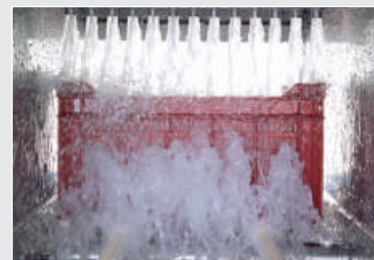
Düsenreinigung von oben und unten

Sprechen Sie uns an. Wir planen für Sie den Warenfluss.