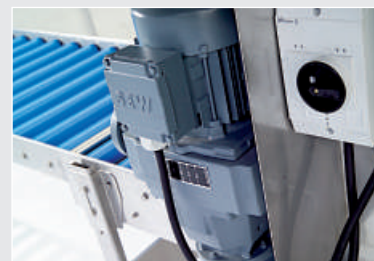
Geschwindigkeit stufenlos regelbar